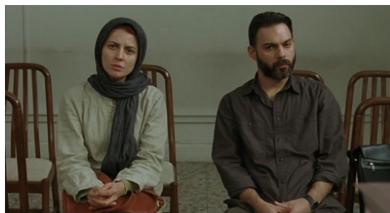
شکل ۱. صحنه دادگاه جدایی نادر و سیمین، دقیقه ۱:۴۳.