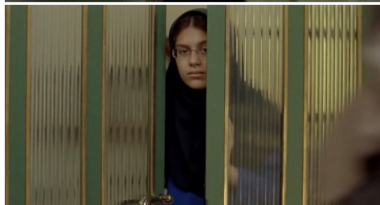
شکل‌های ۹ و ۱۰. اعتراض ترمه به سیمین، دقیقه ۰۱:۰۳:۳۲.