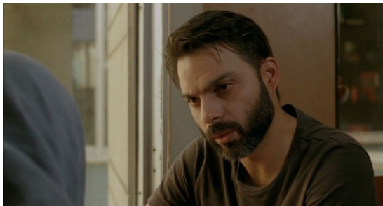
شکل‌های ۱۲ و ۱۳. طرح پرسش از نادر در خصوص دروغ گفتن، دقیقه ۰۱:۳۲:۱۳.