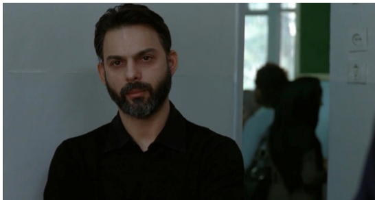
شکل‌های ۱۹، ۲۰ و ۲۱. لحظه اعلام انتخاب پدر یا مادر به قاضی، دقیقه ۰۱:۵۸:۲۰.

تصمیم تنها می‌گذارد، همانگونه که جهان در لحظات دشوار تصمیم‌گیری انسان را در سکوت رها می‌کند. در دقیقه ۰۱:۵۸:۲۰ در حالیکه والدین ترمه از فوکوس خارج شده‌اند، در قاب تنها می‌شود. بنابر اندیشه سارتر، نهاد و اجتماع سبب تشدید اضطراب وجودی می‌شوند، چراکه نگاه دیگری نهادینه می‌گردد. در این لحظه ترمه از سه سو (قاضی، پدر و مادر) در معرض نگاه است. در این صحنه سکوت ترمه را می‌توان کنشی اگزستانسیال به شمار آورد. سکوتی که نه از ناتوانی، بلکه از تردید در انتخاب و در عین حال تلاشی برای خروج خود از شی‌واره‌گی ناشی می‌شود (اشکال ۱۹ الی ۲۱).