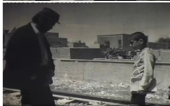
تصاویر ۵ و ۶. شکستن خط فرضی: تعکس کودک و نصرالله در مقام خودبازتابی و دیگری (مرثیه، ۱۳۵۶).