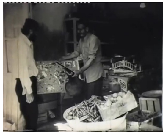
تصویر ۷. بازگشت ابژه کوچک a (تفنگ‌وتخته) به حوزه واقعیت.