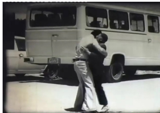
تصویر ۲. حفره در سطح دال: بازنمایی غیاب دال نخستین (نام پدر) از طریق حضور دال دیگری (مرثیه، ۱۳۵۶).

این حفره، زمینه‌ساز تفسیر موقعیت نصرالله در بافتی شبیه‌سازی شده از مفهوم محرومیت است که در نهایت امر به سایکوز مالیخولیایی سوژه راه می‌برد. آنچه در اینجا از طریق رویکردی لکانی در رابطه با حفره یا به عبارتی، فقدان دال نخستین (نام پدر) تولید می‌شود، گسستی در پیوندهای گفتمانی ۶۱ (یک دال با دال بعدی)، در گره برومهای (واقعی، نمادین و خیالی) و در زنجیره نسلی ۶۱ (ساختار خویشاوندی) خواهد بود (Braunstein, 2015: 88). از همین روی، تفسیر فرض را بر آن بنا می‌نهد که در مورد نصرالله کماکان یک وحدت خیالی با مادر وجود دارد و زندان به مثابه فضایی بینابینی، موقتاً فقدان دال نام پدر و گونه‌ای «نقص در ساختار ادیبی» سوژه را به حالت تعلیق درآورده است. او، با گمان بر اینکه هنوز نقطه اتکایی در شهر وجود دارد، پس از آزادی از زندان در پی مادر می‌رود و درمی‌یابد که مرگ وی در چند ماه گذشته رخ داده است. اکنون در شرایطی که فقدان هر مرجع تثبیت‌کننده‌ای، امکان بازخوانی موقعیت سوژه در جهان و جایگاه خویش در میان دال‌ها و نمادها را به نحوی گسسته و ناپایدار می‌نماید؛ فقدان مادر، نظم نمادین شکننده او را که از پیش ناقص است فرو می‌ریزد و «امر واقعی» را به زندگی‌اش وارد می‌آورد. مادر به عنوان زمینه ظهور Das Ding یا ایده‌ای غیرقابل دسترس از امنیت و یکپارچگی اولیه که می‌بایست در یک ساختار ادیبی به صورتی بیگانه و منفک از خود تجربه شود (Lacan, 1992)، در فیلم به عنصری غیرقابل بازنمایی تبدیل می‌گردد که نصرالله تا پیش