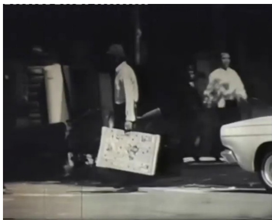
تصویر ۸. پرسه با تفنگ‌وتخته در شهر به مثابه تثبیت سوژه بر ابژه a (مرثیه، ۱۳۵۶).

— میراث خانوادگی و یادمان نام پدر که توسط مادر منتقل شده است — در وضعیت استعاری خود نسبت به ابژه کوچک a ، آخرین تحرکات میل او را به جریان می‌اندازد (Brenner, 2023: 141). از دیدگاهی لکانی در سایکوز «ابژه کوچک a که معمولاً بخشی از واقعیت نیست، به حوزه واقعیت بازمی‌گردد» (Quinet, 1995: 145)، (تصویر ۷). در حقیقت نصرالله آنها را با هدف میل به بقا از کاسب محله بازمی‌ستاند و به عنوان منبع درآمد خود به کار می‌گیرد. اما ابژه a ، ابژه یا هدف میل نیست؛ بلکه علت آن است (Lacan, 2014). بازگشت به این دو شیء گرچه به عنوان عاملی برای بقا عمل می‌کند، اما از نظرگاهی روانکاوانه تلاش خلاقانه سوژه امکانی برای تثبیت جایگاهی نامتزلزل در نظم نمادین فراهم نمی‌سازد. چراکه تفنگ‌وتخته ابزار تولیدی و پایداری نیستند و از آنجاکه در پیکره نمادین رسمیتی نمی‌یابند، در قالب تلاشی برای ورود به گفتمان نامأنوس به نظر می‌رسند. بنابراین هرگز قادر به بیان کامل میل نمی‌گردند و به‌زعم لکان «در فرایند دال‌پردازی گم می‌شوند» (Lacan, 2014: 174). نصرالله تفنگ‌وتخته را به دنبال خود این‌سو و آن‌سو می‌کشاند و آنها را به بخشی از میزانشین شهر تحمیل می‌کند (تصویر ۸). به واقع او در موقعیتی شبه‌نمادین استمرار می‌یابد و هر بار که خرده‌پولی به دست می‌آورد، تجربه دوگانه سرخوشی و رنج به مثابه کنایه‌ای از افتادن سوژه در مدار ژوئیسانس (De Luca Pici, 2024: 17)، او را فرا می‌گیرد. از این‌رو خطر نزدیکی افراطی به ابژه a و تثبیت در ساختار مالیخولیا کماکان وی