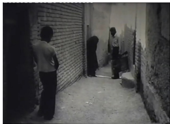
تصویر ۱۰. بازسازی میزاسن سه نفره: فاصله‌گیری کودک از مادر و خود بازتابی (مرثیه، ۱۳۵۶).

در صحنه بعدی نصرالله درون قاب‌های بسته و منزوی کافه‌ای مشاهده می‌شود. پرسش پیرمرد ارمنی کافه‌دار که می‌خواهد بداند او چه می‌خواهد، بی‌پاسخ می‌ماند. گویی در تقاطعی که «گفتمان او را به شکست کامل و ناپدید شدن تهدید می‌کند» (لکان، ۱۴۰۲: ۲۹۸)، لکنت نصرالله جای خود را به سکوت محض داده است. او فقط اسکناس‌ها را از جیب بیرون می‌آورد و فیلم‌ساز از نمای بسته اسکناس‌ها، از چهره مبدل ابژه a به نصرالله در خیابان برش می‌زند. اکنون سوژه ملانکولیک بر صحنه جهان ۶۶ ظاهر می‌شود. صحنه‌ای که انسجام دلالتی خود را برای او از دست داده