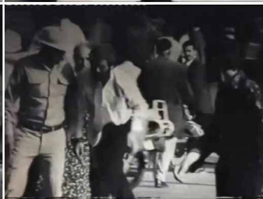
تصاویر ۱۳. خیابان به منزله امر واقعی ناممکن و تکه‌تکه شدن سوژه توسط ژوئیسانس در سرگردانی و مستی (مرثیه، ۱۳۵۶).