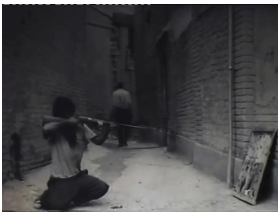
تصویر ۱۲. جدایی نصرالله از یادمان نام پدر و پیشروی به سوی امر واقعی (مرثیه، ۱۳۵۶).

ابژه a، جز احاطه شدن توسط امر واقعی و عرصه ویرانگر ژوئیسانس، چیز دیگری نخواهد بود. تفنگ و تخته که هیچ جایگزینی در نمادین نیافته‌اند، در امر واقعی ناممکن بازمی‌گردند (Chiesa, 2007: 57).