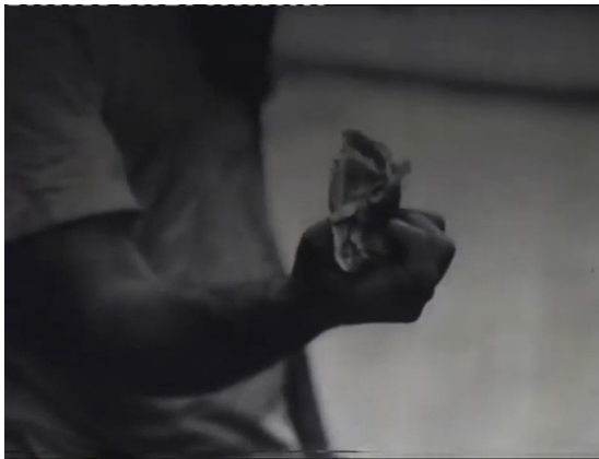
تصویر ۱۱. اسکناس‌های مچاله به مثابه چهره مبدل ابژه a.

است. دوربین مدتی وی را که از لابه‌لای مردم و ماشین‌ها در مستی پرسه می‌زند، دنبال می‌کند و آنتروپی شهر ۶۵ در نماهایی منقطع همچون امر واقعی، موهوم و بی هیچ‌گونه همیستواری وجودی (ژیتک، ۱۳۸۹: ۲۷۵)، نصرالله را در بر می‌گیرد. دالی که محور تمام بیان‌ها بود (نام پدر) جای خود را در زنجیره پیدا نکرد؛ همه دال‌های دیگر بی‌هدف و سرگردان هستند و سوژه محکوم به پرسه زدن است (Braunstein, 2015: 88). اینک کنایه‌ای از ژوئیسانس مالیخولیایی یا همان ماده خامی که سوژه سایکوتیک بی‌آنکه مخاطبی داشته باشد، برای بیان خویش بدان متوسل می‌شود (Braunstein, 2015: 94)، در مستی و سرگردانی، در سرخوشی و رنجی توأمان فوران می‌کند. سوژه «در محاصره آن است» و او سوژه را درون نماهای پراکنده شهر «تکه‌تکه»