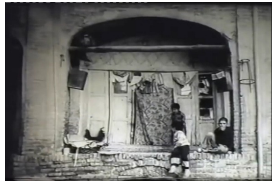
تصویر ۳. اتاق مادر بعد از مرگ: مادر به عنوان Das Ding ، ایده‌ای غیرقابل‌بازنمایی در فیلم (مرثیه، ۱۳۵۶).

پس از ملاقات با خانوادهٔ هم‌بند سابق، نصرالله می‌کوشد تا این بار میزانشن شهر را در چارچوب واقعیتی نمادین فهم کند؛ اما واقعیتی خارج از دال‌های بافته شده