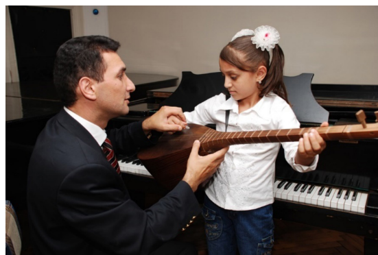
تصویر ۳. آموزش هنر عاشیقی (UNESCO, 2009).

هر هنر مکتبی، مبتنی بر سنت تبعیت از استاد است. این سنت که منجر می‌شود رسم کهن به عنوان میراثی ماندگار حفظ گردد و به عنوان فرهنگ معنوی قومی مد نظر باشد، از ظرفیت‌های هنر عاشیقی است. الگوهای از پیش تعریف شده سرمشق‌هایی برای خلق بدایع محسوب می‌شوند. بداهه‌سازی با اعتماد و رهایی آغاز می‌شود و با ایده‌ای پیشنهادی به سوی خلق شدن حرکت می‌کند. استاد برای اصلاح و یا بهتر شدن اجرای شاگرد، پیشنهاداتی دارد که