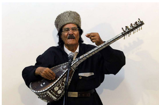
تصویر ۵. عاشیق دهقان، داستان‌گویی در هنر عاشیقی.

یکی از جذابیت‌های هنر عاشیقی، به دست آوردن قلب مخاطب با بیانگری غیرکلامی است. عاشیق ساز به دست با زخمه‌ای بی‌کلام بر قوپوز، اولین ارتباط غیرکلامی خود با مخاطبش را برقرار می‌کند. عاشیق‌ها پیش از آغاز هر نوع روایت، به عنوان مقدمه، ساز می‌زنند و مهم است به سراغ کدام هاوا می‌روند زیرا روشنی‌ساز ادامه مسیر خواهد بود. آنها مانند بازیگران اصول برقراری ارتباط غیرکلامی که