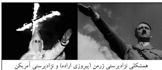
همشکلی نژادپرستی ژرمن (پیروزی اراده) و نژادپرستی آمریکایی

منعکس است». (۱۵) فیلم «پیروزی اراده» ۲۳ (۱۹۳۵) ساخته لنی ریفنشتال ۲۴ هم با تئوری نژاد برتر آریایی تولد خدای جدیدی را به تصویر می کشد. نقطه اوج فیلم در روز چهارم با تصاویری از هیتلر به همراه موسیقی اپرای «شامگاه خدایان» ۲۵ ساخته واگنر ۲۶ شروع می شود و فیلم با آهنگ «پرچم های برافراشته» (۱۶) به پایان می رسد، در حالیکه این خدای جدید اراده حاکمیت قوم برتر را در سر می پروراند.