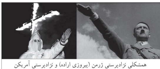
همشکلی نژادپرستی ژرمن (پیروزی اراده) و نژادپرستی آمریکایی

منعکس است». (۱۵) فیلم «پیروزی اراده» ۲۳ (۱۹۳۵) ساخته لنی ریفنشتال ۲۴ هم با تئوری نژاد برتر آریایی تولد خدای جدیدی را به تصویر می‌کشد. نقطهٔ اوج فیلم در روز چهارم با تصاویری از هیتلر به همراه موسیقی اپرای «شامگاه خدایان» ۲۵ ساخته واگنر ۲۶ شروع می‌شود و فیلم با آهنگ «پرچم‌های برافراشته» (۱۶) به پایان می‌رسد، در حالیکه این خدای جدید ارادهٔ حاکمیت قوم برتر را در سر می‌پروراند.